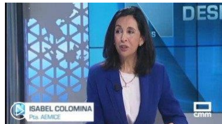
La presidenta, Isabel Colomina, en TV Castilla la Mancha